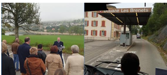
Visite de terrain autour du Lac des Brenets, partagé entre les deux Pays avec une présentation des enjeux de préservation de la ressource en eau entre la France et la Suisse, puis passage de la douane aux Brenets.

[...] Ces conférences peuvent être (re)visionnées en ligne sur la chaîne YouTube de la MOT, tout comme le déroulé des instances, qui ont dressé le bilan de l'année écoulée, validé les rapports d'activité et financier, et procédé à l'élection des nouveaux représentants du Bureau de l'association. Plus d'infos